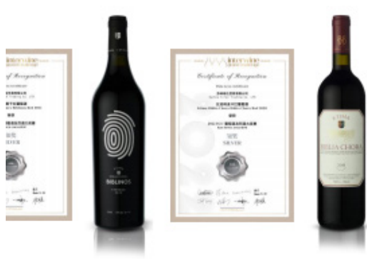
展区内设置酒类体验，展示斯洛文尼亚朗特干红、罗马尼亚 Budureasca、希腊 Ktima Chatzivaritis、Ktima Raptis、Georgiadis Winery 等地理标志物产品。