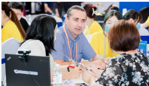
2021年6月9日，第二届中东欧博览会酒类专场对接会和综合对接会在宁波会展中心，邀请部分中东欧供应商进行现场推荐，寻求分销商、代理商拓展中国市场