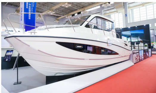
波兰欧尼尔游艇（上届展品）