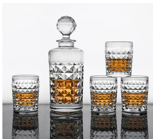
捷克 Crystal Bohemia 水晶，料色白净、透泽度高，在业内有口皆碑，是捷克最大的含铅水晶工厂。