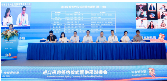
2021年6月9日，第二届中东欧博览会供采对接会邀请了来自国内10余个省市的20家中方采购商，与来自中东欧10个国家的19家参展商举行了59轮次的线上线下贸易洽谈。举行了中东欧商品的进口商与供应商集中签约仪式，共签约26个项目，总签约金额21.86亿元