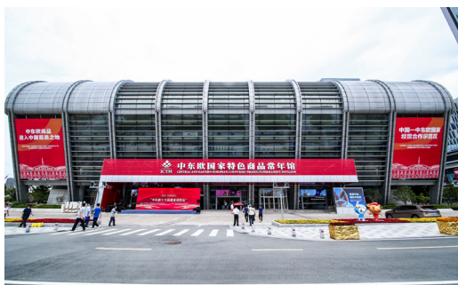
中东欧国家特色商品常年馆外观