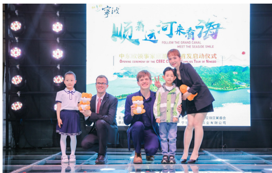
2021年4月23日，“顺着运河来看海”中东欧领事家庭游宁波活动成功举办，来自斯洛伐克、波兰、保加利亚等中东欧国家驻沪总领事家庭和国际化友人参加活动

举办科技、教育、旅游等人文交流活动，推进中国与中东欧国家全方位、多层次的合作交流。