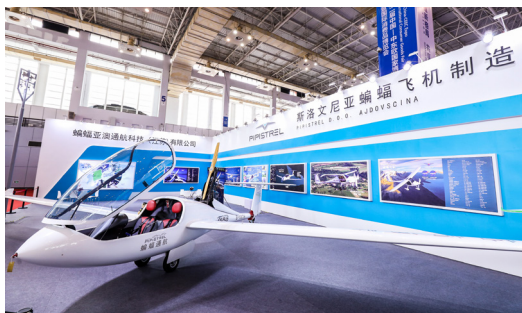
斯洛文尼亚蝙蝠飞机（上届展品）