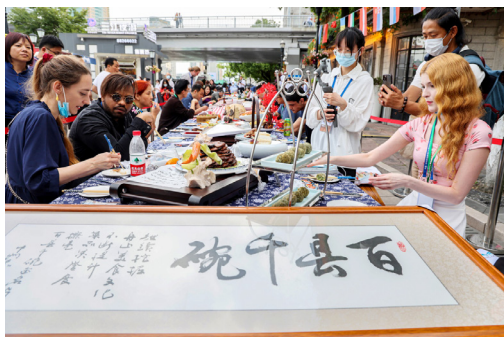
2021年6月7-9日，舌尖上的相遇——中东欧美食与“诗画浙江·百县千碗”活动在宁波举行。外交官厨艺直播、长桌宴、欧洲油画展、中东欧美食挑战赛等丰富多彩的活动，展现浓厚的中西艺术碰撞互融氛围