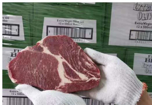
匈牙利牛肉，被誉为“牛肉中的爱马仕”。