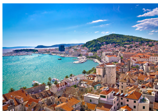
专设服贸贸易展区，展示人文旅游、港航物流等内容。