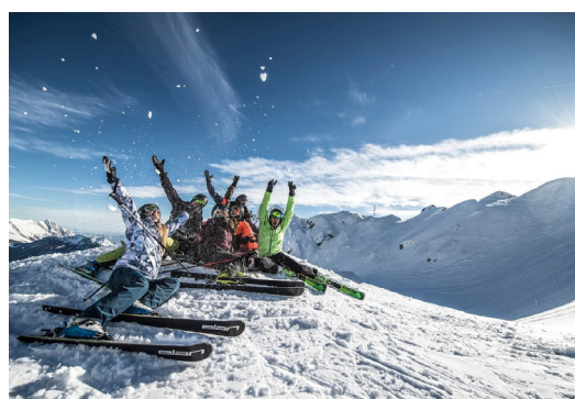
ELAN 是斯洛文尼亚一家专业滑雪制造商，为本届博览会首次亮相展商。