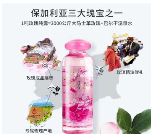
保加利亚玫瑰精油，保加利亚大马士革玫瑰是举世公认的香气最好闻的玫瑰品种。